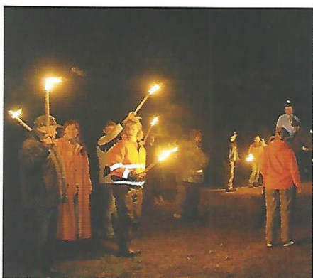
Gute Stimmung nicht nur beim Start

Der Ritt wird seit vielen Jahren veranstaltet, ursprünglich gegründet von den einigen Feuerkreislern.